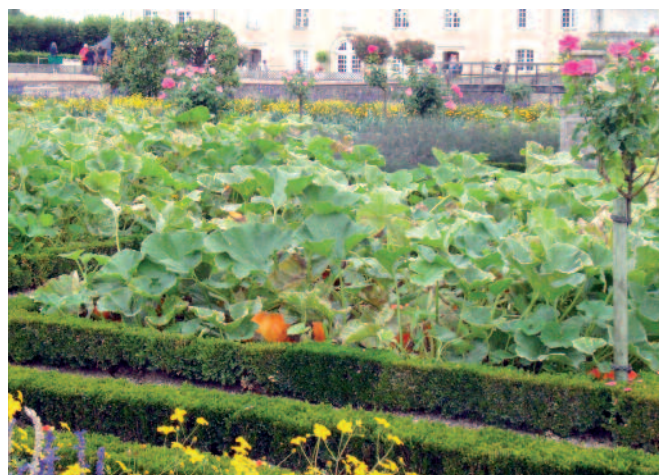
Villandry. I de Felipe

En la mayoría de los casos, hay un denominador común en la agricultura urbana, que incide en la mayoría de los escenarios mencionados. En su vertiente ornamental y alimentaria, puede