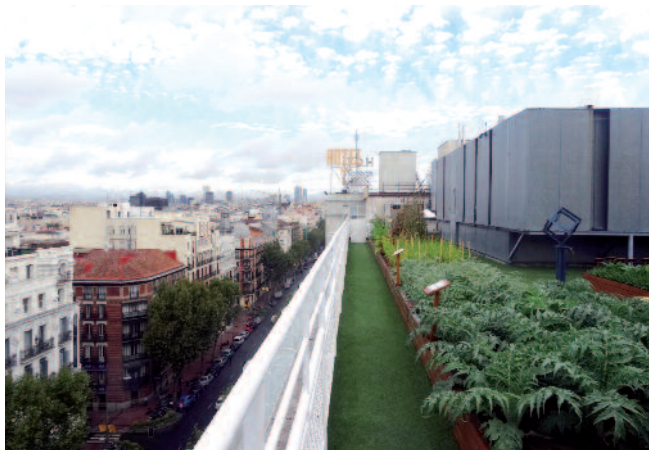
Hotel Wellington Madrid. I de Felipe

trés de la vida moderna. Simultáneamente, la incorporación de la naturaleza en nuestro entorno incrementa la biodiversidad. De hecho, la proporción de la biodiversidad en las actividades agrarias urbanas es muy superior a sus homologas rurales, donde se buscan economías de escala mediante monocultivos en grandes extensiones de cultivo.